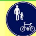
自転車歩道通行可

引受保険会社 三井住友海上火災保険株式会社 大阪南支店 大阪南第一支社 TEL 06-6634-5611